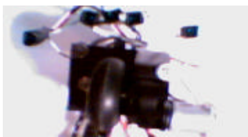
Fig 2. Rueda motriz y sensores.

La principal propiedad de Canus Lanis es que tanto la tracción como el giro son controlados con una sola rueda a través de dos servomotores dispuestos en forma perpendicular. Este control de giro permite obtener una mayor precisión a la hora de seguir la línea negra. Las otras dos ruedas son de giro libre.