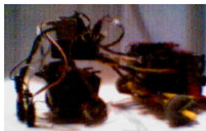
Fig 3. Microbot Canus-Lanis.

un buen despliegue de los sensores para adecuarlos a cualquier necesidad. Sorprendentemente, hemos descubierto que un simple y robusto esqueleto nos ofrece todo eso. Hemos utilizado alambres metálicos trenzados, cinta adhesiva y piezas de construcción Kénex (plástico), que, adaptándose al resto de elementos, sustentan la caja de las pilas, las placas del microcontrolador, la placa de potencia y unen la cabeza motora con las dos ruedas de giro libre. De esta forma se aprovecha en cada elemento su propia rigidez.