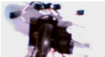
Fig 2. Rueda motriz y los 5 sensores.

La principal propiedad de Canus Lanis es que tanto la tracción como el giro son controlados con una sola rueda a través de dos servomotores dispuestos en forma perpendicular. Este control de giro permite obtener una mayor precisión a la hora de seguir la línea negra. Las otras dos ruedas son de giro libre.