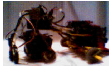
Fig 3. Microbot Canus-Lanis.

Para la plataforma mecánica se ha buscado una solución que ofreciese adaptabilidad, robustez, ligereza y, al mismo tiempo, que no ofreciese limitaciones en la elección de las diferentes disposiciones que pudieran adoptar los distintos elementos del robot en la fase de diseño además de permitir un buen despliegue de los sensores para adecuarlos a cualquier necesidad. Sorprendentemente, hemos descubierto que un simple y robusto esqueleto nos ofrece todo eso. Hemos utilizado alambres metálicos trenzados, cinta adhesiva y piezas de construcción Kénex (plástico), que, adaptándose al resto de elementos, sustentan la caja de las pilas, las placas del microcontrolador, la placa de potencia y unen la cabeza motora con las dos ruedas de giro libre. De esta forma se aprovecha en cada elemento su propia rigidez.