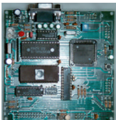
Figura1. Placa de control

El sistema Hardware se basa en un microcontrolador HC11E2 en modo single chip , y en un doble puente en H integrado L293D.